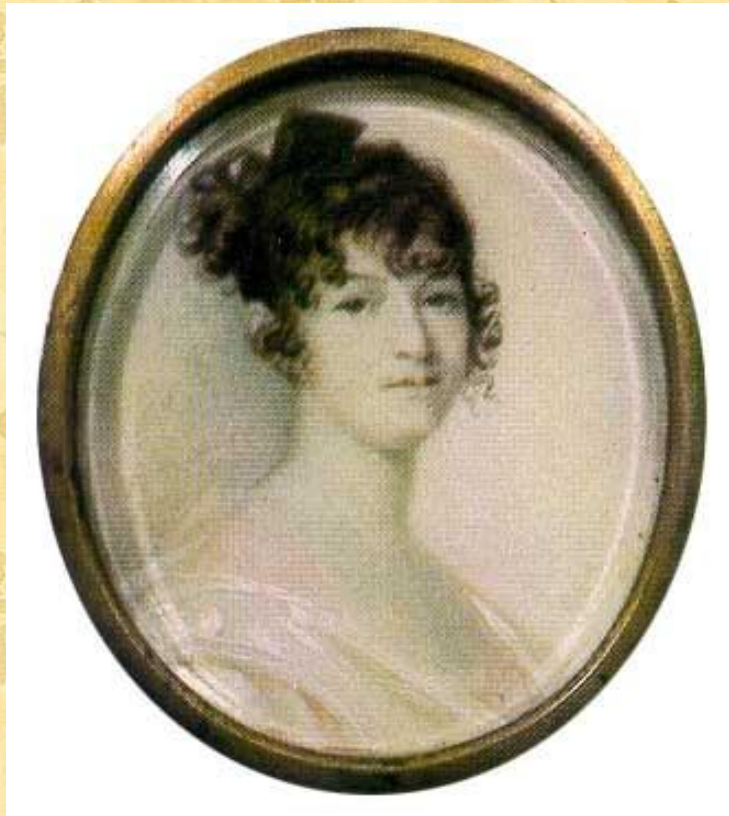
Н.О. Пушкина. 1800-е гг.

Мать, Надежда Осиповна , приходилась внучкой арану Петра I, впоследствии русскому генералу Ганнибалу.