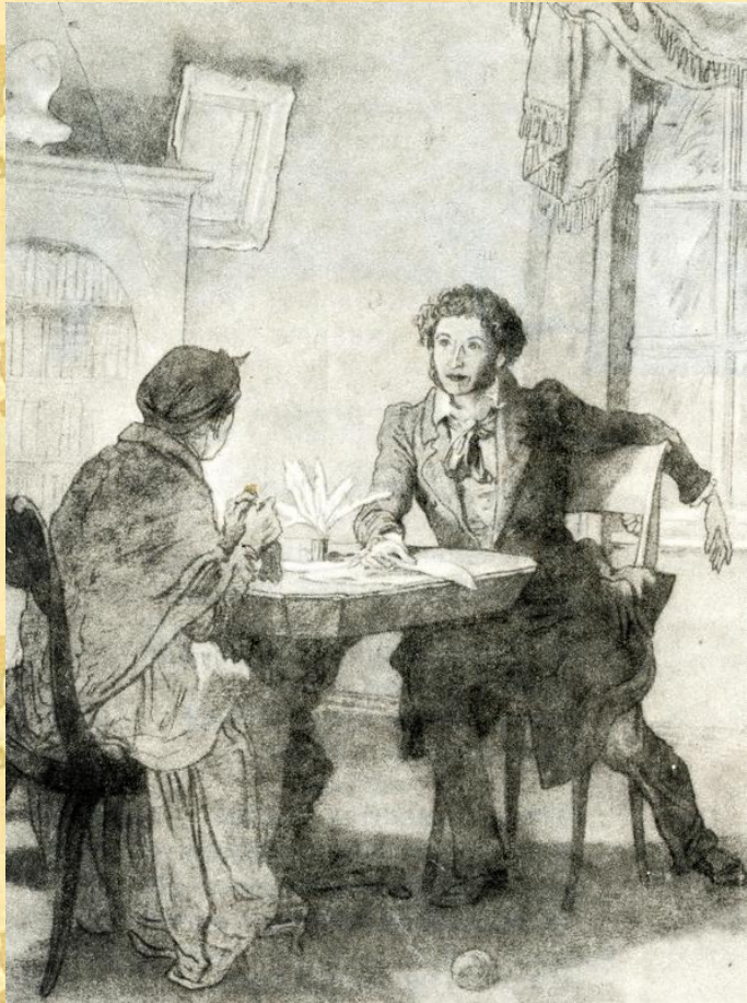
Иллюстрация к стихотворению «Зимний вечер»

Забота и любовь Арины Родионовны скрашивали поэту ссылку. Пушкин по-настоящему крепко любил свою няню и написал несколько трогательных стихотворений, к ней обращенных.