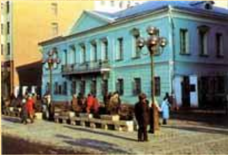
Квартира Пушкина в Москве на Арбате

18 февраля 1831 г. в церкви Вознесения Господня состоялось его венчание с Н.Н.Гончаровой. Первые месяцы семейной жизни он провел с женой в Москве, сняв квартиру на Арбате