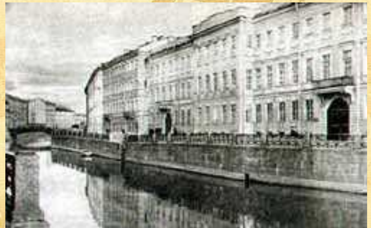
Квартира Пушкина в Петербурге на Набережной Мойки

С середины октября 1831 г. и уже до конца жизни Пушкин с семьей живет в Петербурге.