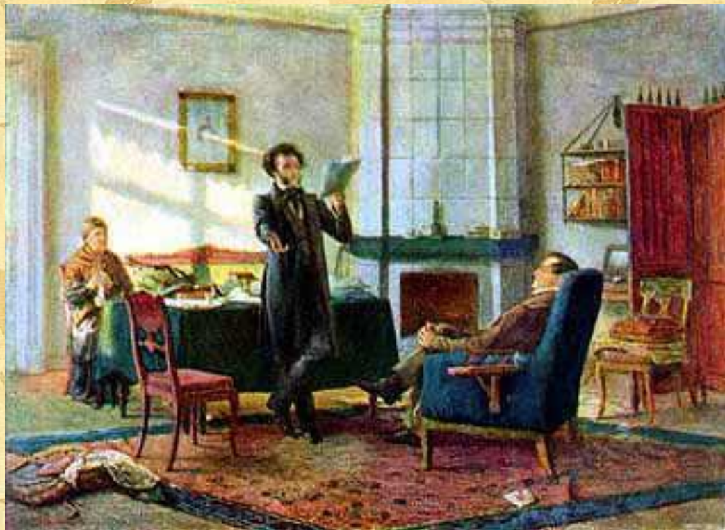
Пушкин в селе Михайловском (Пушкин у Пушкина). Н.Н. Ге. 1875 г.

За три года ссылки написаны "Кавказский пленник", "Бахчисарайский фонтан", а также "Узник", "Песнь о Вещем Олеге». Начат роман в стихах "Евгений Онегин".