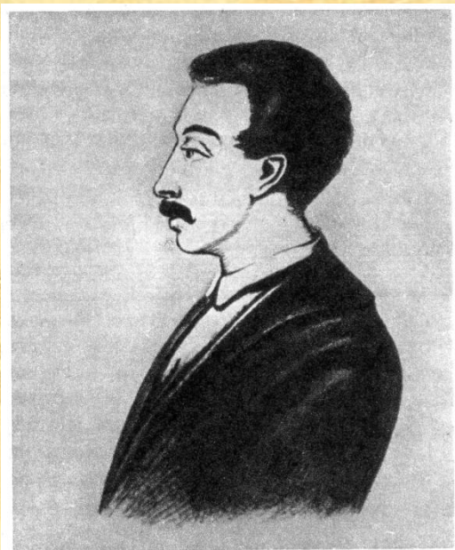
Вильгельм Карлович Кюхельбекер